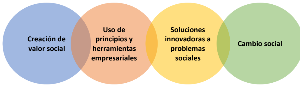
Figura 1. Elementos del Emprendimiento Social