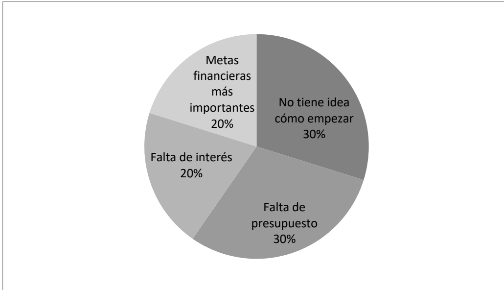
Gráfico 2. Por qué no se trabaja en RSE